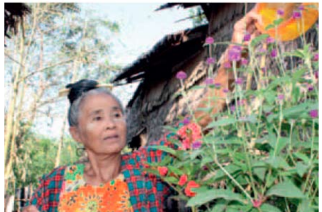
Cultivo de flores para la venta en Myanmar.

Mientras las pensiones, y particularmente las pensiones sociales, constituyen un importante fin en sí mismas, puesto que representan una enorme diferencia en el bienestar de las personas de edad, también se ha demostrado que benefician a familias